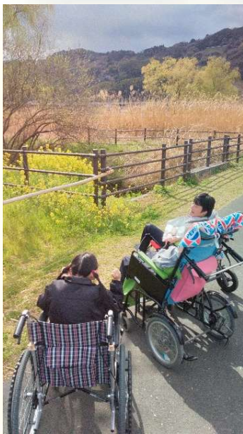
外出「あさはた緑地公園」では、きれいな菜の花を鑑賞しました！ 春を満喫！